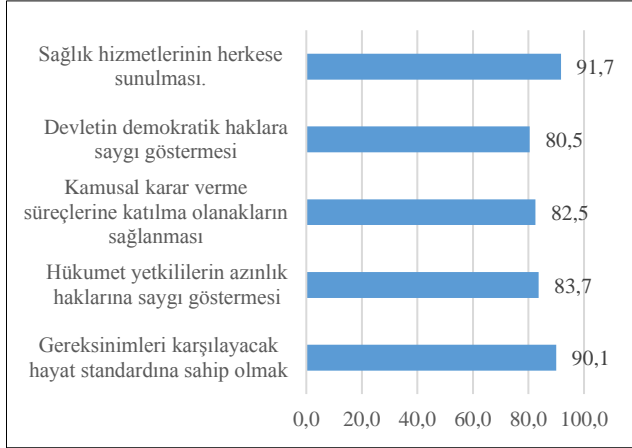
Figür 2. Hak eksenli vatandaşlık normlarına “çok önemli” diyenler (%)

Buna ek olarak demokratik haklar, azınlık hakları ve karar verme süreçlerine katılım konuları da %80 üzeri “çok önemli” olarak görülmektedir. Türkiye’de liberal normlara atfedilen yüksek değer Türkiye’de vatandaşlık algısı ve anlayışında süregelen tanımlara karşı dönüşümü desteklemektedir.