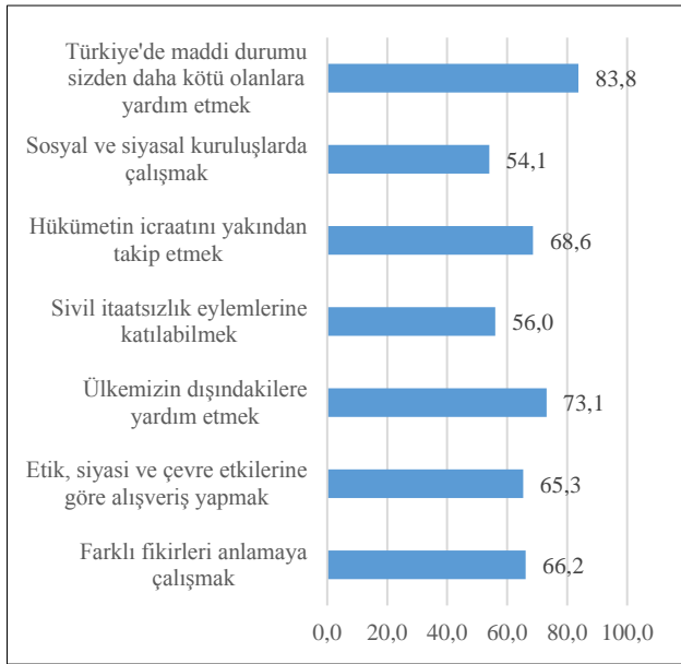
Figür 3. Aktif vatandaşlık normlarına “çok önemli” diyenler (%)

Liberal ve görev odaklı vatandaşlık normlarından sonra en büyük destek, aktif vatandaşlık normlarına verilmiştir (Figür 3). Aktif vatandaşlık normları katılım ve topluluk olma değerlerini kapsamaktadır. Bu norm, bir yandan sosyal ve siyasi kuruluşlarda çalışmak, sivil itaatsizlik eylemlerine katılmak ve hükümet icraatını takip etmek gibi toplumun işleyişini pekiştirmeyi ve vatandaşların sorumluluklarını kapsamakta; diğer yandan da farklı fikirleri anlamak, Türkiye’de ve Türkiye dışındakilere yardımcı olmak gibi yerel ve küresel seviyede topluluklara açık olmak, zor durumda olanlara karşı sorumluluk almak gibi normları vurgulamaktadır. Katılımcıların %50’si ile %75’i arası bu normların “çok önemli” olduğunu düşünmektedir. Hak talepleri ile karşılaştırıldığında aktif vatandaşlık normlarının nispeten daha az önemsendiği ortaya çıkmaktadır. Aktif vatandaşlık normu altında,